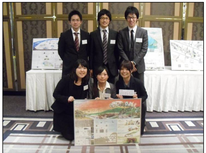
新入社員で構成したチーム